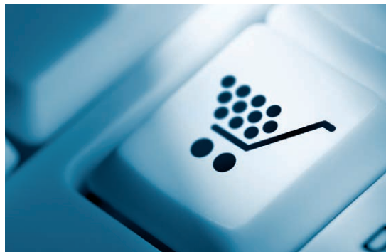
Online-Handel beschäftigt die Gerichte

» Sachverhalt: Der Online-Zahlungsdienst PayPal stellt seinen Kunden in den Allgemeinen Geschäftsbedingungen mit der sog. Paypal-Käuferschutzrichtlinie ein Verfahren zur Verfügung, wonach der Zahlvorgang auf Antrag des Käufers rückgängig gemacht wird, wenn der Käufer den Artikel nicht erhalten hat oder dieser erheblich von der Beschreibung abweicht. In zwei jüngst vom BGH entschiedenen Fällen hatten die Verkäufer nach entsprechender Rückbelastung ihres PayPal-Kontos den jeweiligen Käufer für erneute Zahlung des Kaufpreises verklagt. Fraglich war insoweit, ob der Kaufpreisanspruch mit der zunächst erfolgten Gutschrift auf dem PayPal-Konto des Verkäufers bereits erloschen war. Dies hat der BGH nun verneint. Nach Deutung des Gerichts wird bei Verwendung des PayPal-Systems still-