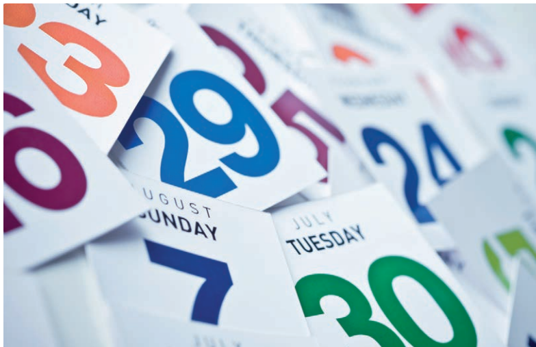
EuGH leitet maximale Zahl von Arbeitstagen am Stück ab

pro Siebentageszeitraum eine kontinuierliche Mindestruhezeit von 24 Stunden zzgl. der täglichen Ruhezeit von elf Stunden“ gewährt wird. Der Arbeitgeber