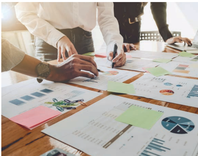
Qualitätsprüfung der umsatzsteuerlichen Datenaufzeichnungen und Meldungen