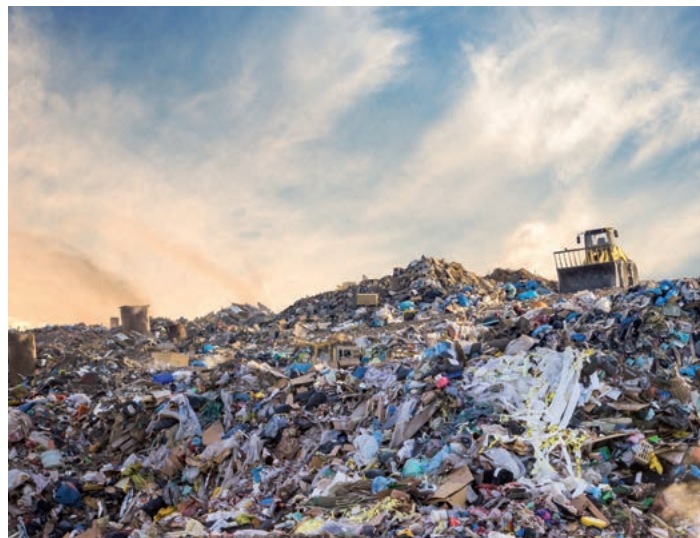
Nach Stilllegung zu tragende Aufwendungen rückstellungsfähig?