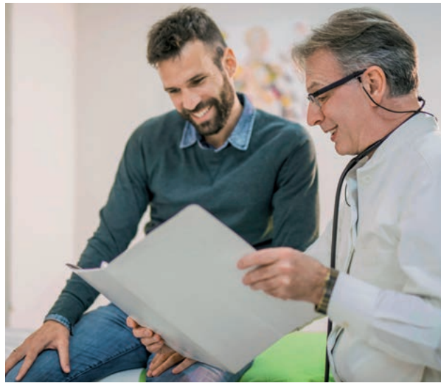
Arztbesuche müssen sein, aber ist das Arbeitszeit?

Das BAG sieht dabei den Grundsatz der freien Arztwahl und verlangt von Arbeitnehmern nicht, zu einem Arzt