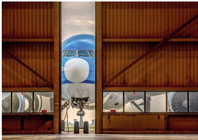
Wartungsarbeiten auf dem Rückstellungs-Prüfstand

» Sachverhalt: Ein Halter eines Flugzeugs oder der Mieter (im Folgenden: Betreiber) einer Aufzugsanlage ist gesetzlich dazu verpflichtet, Wartungsarbeiten und wiederkehrende Prüfungen zur Betriebssicherheit bei Erreichen von zulässigen Betriebszeiten durchzuführen (vgl. § 12 LuftGerPV / BetrSichV 2015). Erst danach darf er den Betrieb fortsetzen. In einem vom BFH entschiedenen Fall hatte der Eigentümer des Flugzeugs bzw. der Aufzugsanlage die mit der Wartungsverpflichtung verbundenen Kosten auf den Betreiber abgewälzt. Der Betreiber des Flugzeugs hatte die gemieteten Flugzeuge „im Einklang mit den luftverkehrsrechtlichen Bestimmungen“ (bezogen auf Betriebszeiten) auf eigene