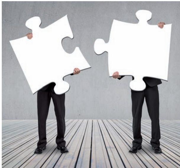
Verschmelzung im Konzern wohl weiterhin grunderwerbsteuerfrei möglich

einhalten der Nachbehaltensfrist verweigert hatte. Weiterhin hat der BFH das BMF aufgefordert, dem Verfahren bezüglich der Voraussetzungen für die Steuerbefreiung nach § 6a GrEStG beizutreten. Mit Entscheidung vom 30.5.2017 hat der BFH den Fall dann dem EuGH mit der Frage vorgelegt, ob die Konzernklausel des § 6a GrEStG mit dem unionsrechtlichen Beihilfeverbot der Art. 107 ff. AEUV vereinbar ist (BStBl II 2017 S. 916).