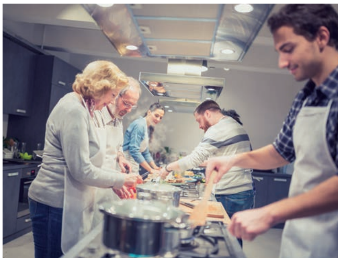
Kochkurs als Betriebsveranstaltung

Auslöser dieses Urteils war die Klage einer GmbH, welche einen Kochkurs für ihre Mitarbeiter als Betriebsveranstaltung durchgeführt hatte. Im Rahmen des Kochkurses durften die Teilnehmer unbegrenzt Getränke und Speisen verzehren. Es wurden 27 Teilnehmer angemeldet, von denen jedoch zwei kurzfristig absagten. Die Kosten der Veranstaltung blieben unverändert. Das Finanzamt verlangte, im Rahmen der Ermittlung der lohnsteuerpflichti-